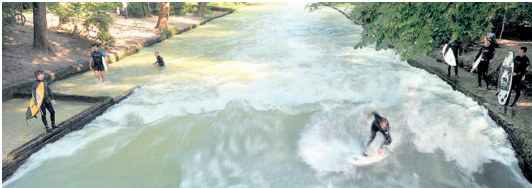
In München ist die stehende Welle im Eisbach (Bild) eine Surfer- wie Touristenattraktion. In Zürich stehen die Limmatwellen-Promotoren noch immer an.